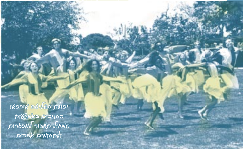
יכולת השליטה שירכשו האניכיס באמצעות המחול תעבור למסגרות ולתחומים אחרים

מחול הוא שפה, שפה בימתית שבאמצעותה הכוריאוגרף והרקדנים מספרים ומציגים נושאים וסיפורים שונים. רקדן המשתין ללהקת מחול, נדרש ללמוד שפה זו על בוריה כדי שיוכל להתבטא באמצעותה. עם בת/בן זוג צמודים ועוד מספר רב של זוגות על הבמה,